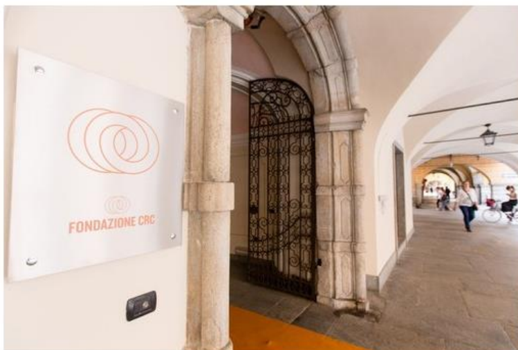
La sede della Fondazione CRC

Contestualmente, la Fondazione ha lanciato il nuovo bando "No Amianto"